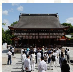
京都切廻り 八坂神社